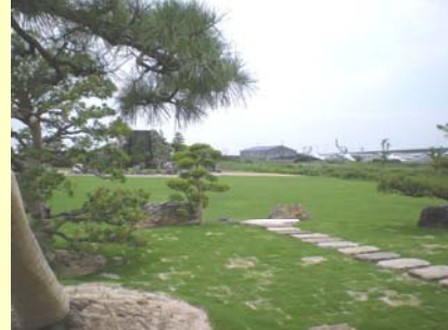
店舗内の広大な緑地