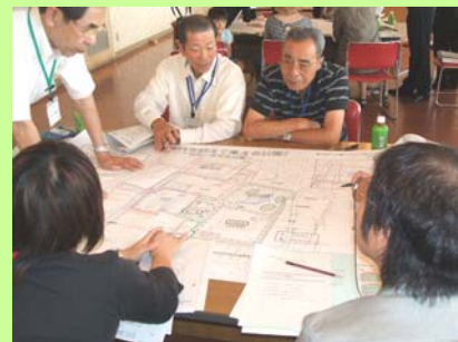
住民参加による公園づくり (緑の公園づくりの様子)