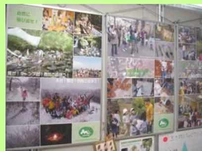
緑に関するイベントの開催