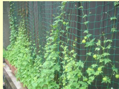
家庭における緑のカーテンの実施

また、本町には「リサイクル花の会」や「一色排水路をきれいにする会」などの地域活動団体が存在しています。これらの活動団体が中心となり、町民の緑化啓発や活動の契機となるような取り組みの実施が期待されます。